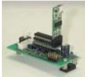
図2. ターゲットボードに装着した例