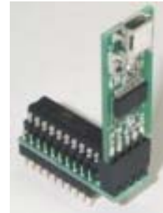
図4. 弊社"USB232W"で書き込み中