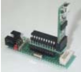
図2. ターゲットボードに装着した例